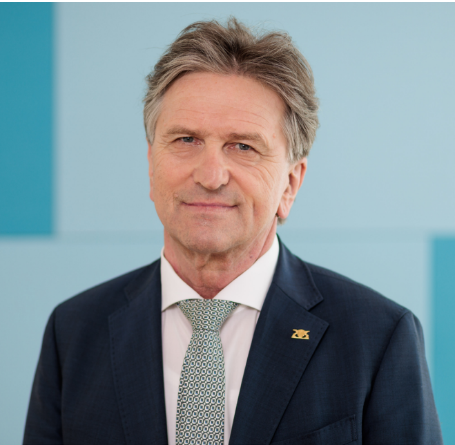
Manne Lucha , Minister für Soziales, Gesundheit und Integration Baden-Württemberg

Roadmap Antidiskriminierung „Stark gegen Diskriminierung – Unser gemeinsamer Weg“ (RM-AD) beinhaltet 25 Maßnahmen, welche schrittweise bis einschließlich 2030 im Zuständigkeitsbereich des Ministeriums für Soziales, Gesundheit und Integration umgesetzt werden sollen.